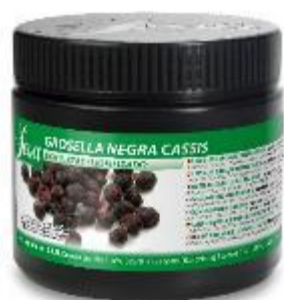
39469 – GROSELLA NEGRA

Descatalogación del producto por bajo volumen de ventas y dificultad en la MP