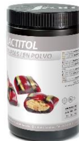
37391 - LACTITOL 1 Kg

Se procede a una descatalogación del artículo en Enero de 2024 debido a que con bajo volumen de ventas que hace que la continuidad de su producción no sea factible/operativa.